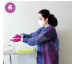
6 Desinfecta los guantes con una solución a base de alcohol.