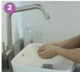
2 Humedece tus manos.