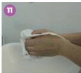
11 Seca tus manos con una toalla desechable.