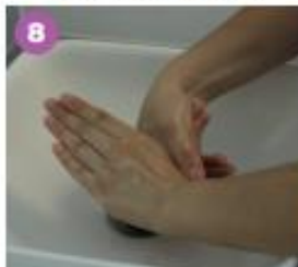
8 Frota tu pulgar izquierdo en un movimiento rotatorio con la palma de tu mano derecha; y viceversa.