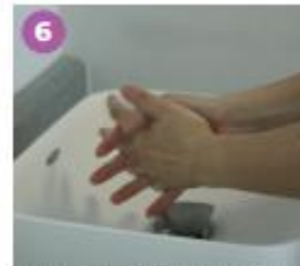
6 Frota la palma de tus manos entre sí, entrelazando los dedos.