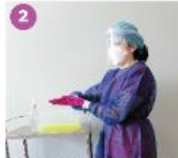
2 Desinfecta los guantes con una solución a base de alcohol.