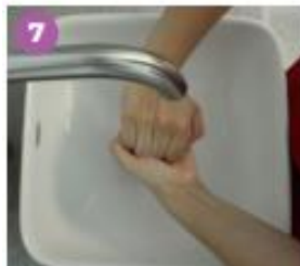
7 Frota el dorso de los dedos de una mano, con la palma de la otra mano, agarrándote los dedos.