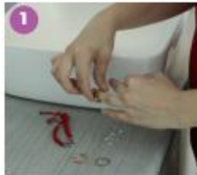
1 Retira cualquier tipo de joyería de tus manos.