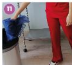
11 Envuelve los guantes en la bata y desecha ambas cosas.