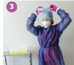
3 Retira la correa y los lentos de seguridad, y colócalos en una solución desinfectante.