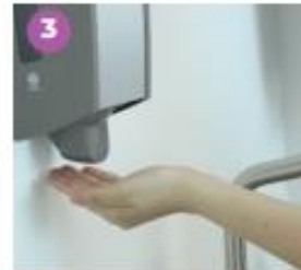
3 Toma la cantidad de jabón líquido necesaria para cubrir toda la superficie de tus manos.