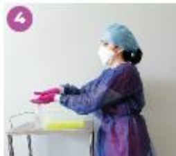
4 Desinfecta los guantes con una solución a base de alcohol.