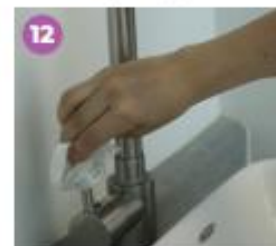
12 Con la misma toalla, cierra la llave del lavabo.