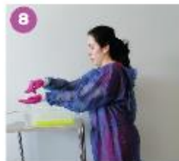
8 Desinfecta los guantes con una solución a base de alcohol.