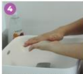
4 Frota las palmas de tus manos una con la otra.