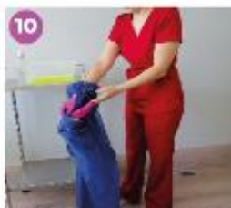
10 Al mismo tiempo que la retiras, quita también el primer par de guantes quirúrgicos.