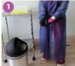
1 Con cuidado retira y desecha el primer par de guantes.