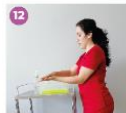
12 Desinfecta tus manos con una solución a base de alcohol.