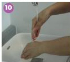
10 Enjuaga con agua tus manos para retirar el jabón.