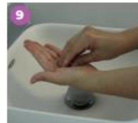
9 Frota la punta de los dedos de la mano derecha contra la palma de la mano izquierda; y viceversa.