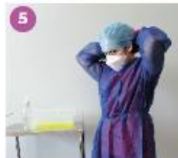
5 Retira y desecha el gorro.