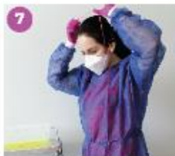
7 Retira la mascarilla quirúrgica o el respirador N95.