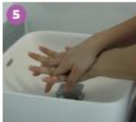
5 Frota la palma de una mano con el dorso de la otra, entrelazando los dedos. Luego, viceversa.