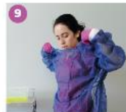
9 Retira la bata de forma lenta y cuidadosa, tomándola por el interior.